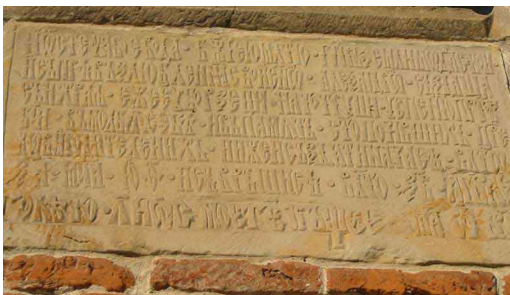
Copyright by Vladimir Cherny, GNU Free Documentation License, Low Resolution